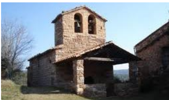
Ermita romànica de Viladellewa

Portar esmorçar, aigua i ganyips per picar.