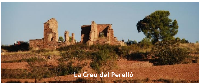
La Creu del Perelló

Sortim de davant del restaurant Cal Toni en direcció al Mirador del Montserrat, passem per Cal Saleta, Vallbona i enfilem cap a Viulatorrada, abans però ens desviem direcció Viladellewa, allà podem admirar la bonica església romànica. Tot seguit continuem en pujada tot buscant el Puig de Sans (600 m.). D'aquí pel Serrat del portell del Llop arribem a Coldeforn, passem el Bosc d'Argençola per sobre i arribem a la Creu del Perelló. Aquí ens vindran a buscar per a retornar al punt de sortida.